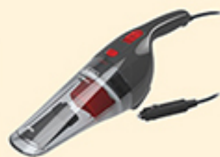
пылесос для авто