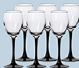
н-р бокалов Luminarc